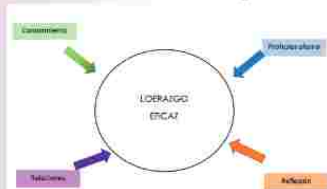
Gráfico 3 Características del liderazgo