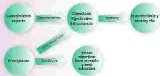
Gráfico 2 Organización del conocimiento

la diferencia con los participantes que recién ingresan a los centros: