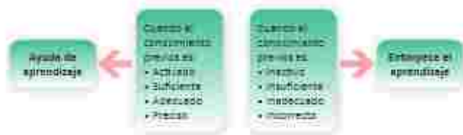
Gráfico 1 El conocimiento previo que ayuda al aprendizaje

Quizá por ello sea necesario que el facilitador/a planifique con detalle las metas de aprendizaje y no de forma general pues no serviría de mucha orientación a la hora de verificar o comprobar lo que se aprendió o lo los participantes. Sin embargo, la motivación por el aprendizaje es una base segura que hace que estas dificultades puedan ser superadas por los propios participantes y la pedagogía andragógica que el facilitador ha planificado. El siguiente gráfico puede ayudar a observar este principio de trabajo: