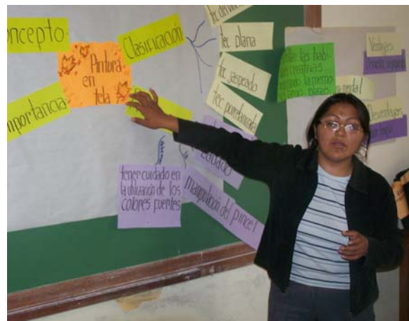
Facilitadora del CETHA Irupana explica su aplicación del mapa mental como técnica de evaluación