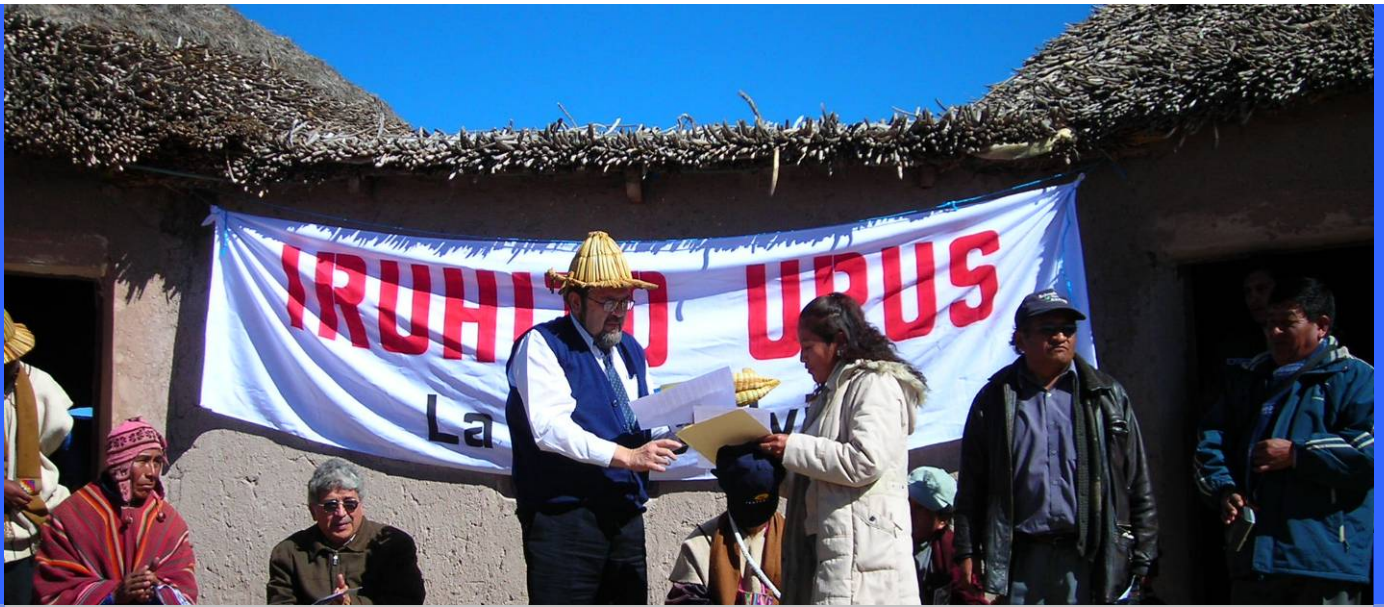
PETITORIO. El Ministro de Educación, Roberto Aguilar, recibe de manos de los asambleístas de FERIA el pliego petitorio con las demandas de la Red para la mejora de la educación alternativa en Bolivia.