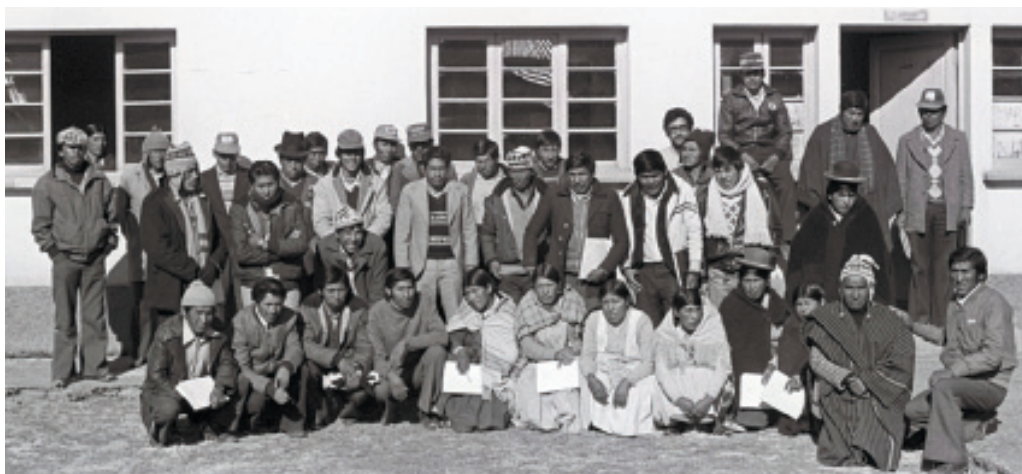
Promotores culturales aymaras y miembros del Centro Avelino Siñani a finales de los años 80.

Reafirmación identitaria , (“Khitipxtansa”), frente a un contexto tan discriminatorio. Alfabetización bilingüe (Pä arut qillqañani): fue admirable la campaña de 1974 en 7 provincias, atendiendo con medios tan precarios a miles de comunarios/as, gracias a promotores comunitarios voluntarios. Enseñanza de artesanías ancestrales (sawuña, pit’aña, sañu luraña...). Recuperación (de boca de los Achachilas) de agro-tecnologías ancestrales. Forestación con especies nativas (kiswa, principalmente). Vitalización de la lengua materna y elaboración de folletos populares bilingües. Revalorización de las prácticas curativas andinas (qullañ quranaka, por ejemplo). Rescate de las tradiciones, sabiduría y espiritualidad de sus antepasados.